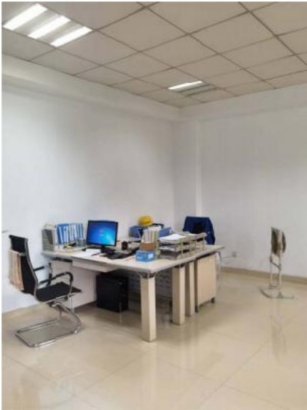
良好的工作环境照片